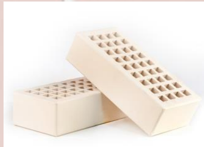
Лицевой пустотелый (слоновая кость)