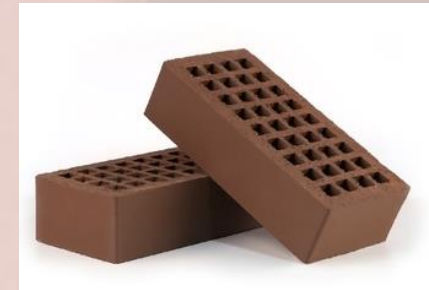
Лицевой пустотелый (коричневый)